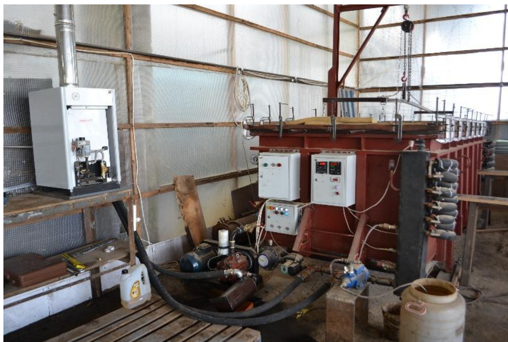
Рис.2. Камера «Энергия ПВ3». Пусконаладка при переводе на газовый нагрев.