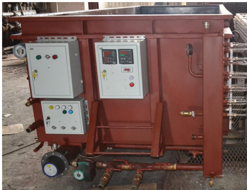
Рис.1. Камера «Энергия ПВ3».

Проведение пробного пуска и обучение персонала Заказчика - бесплатно .