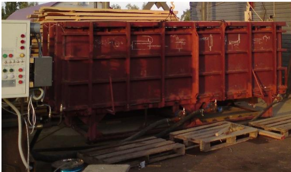
Рис.1. Камера «Энергия ПВ5».

Проведение пробного пуска и обучение персонала Заказчика при отгрузке - бесплатно .